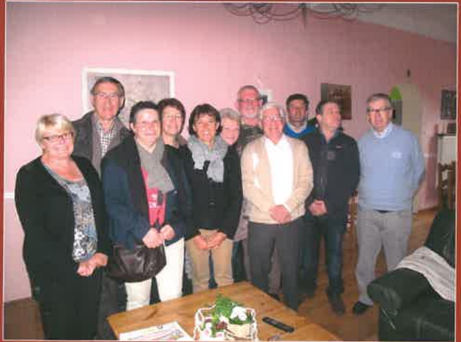
Les délégations de Solesmes Sarthe et Solesmes Nord