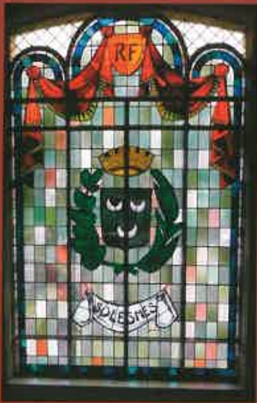
Blason de la commune de Solesmes Nord sur un vitrail de la mairie