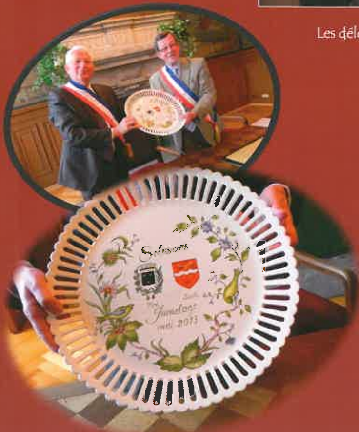
Notre commune a offert une faïence de Malicorne à la commune de Solesmes Nord