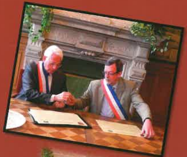
Signature de la Charte de jumelage